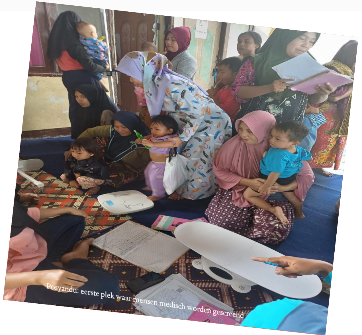
Posyandu: eerste plek waar mensen medisch worden gescreend