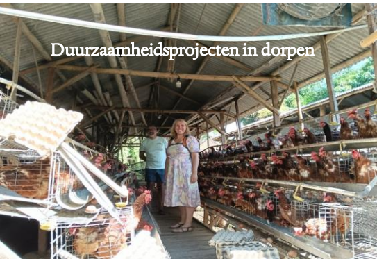
Duurzaamheidsprojecten in dorpen