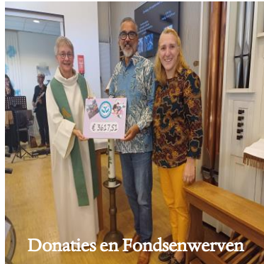
Donaties en Fondsenwerven