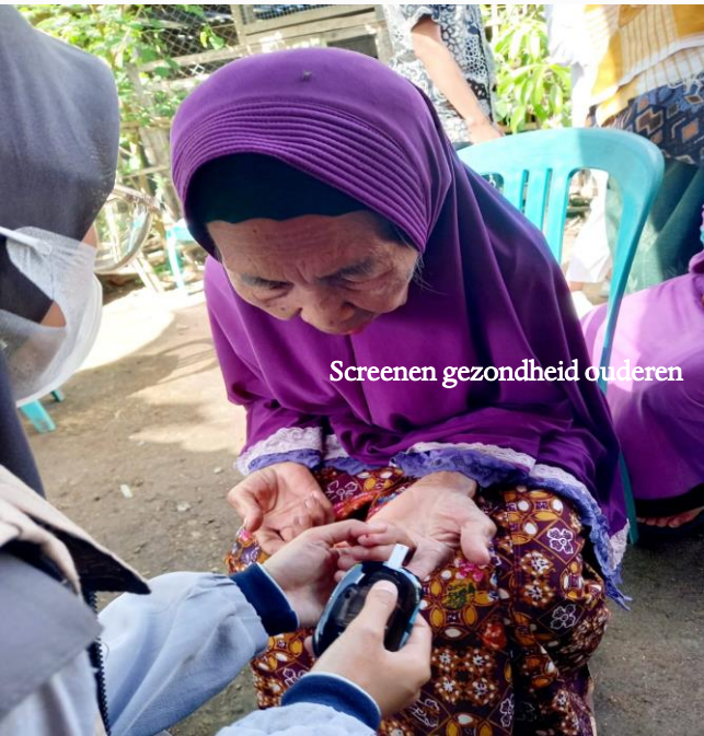
Screenen gezondheid ouderen