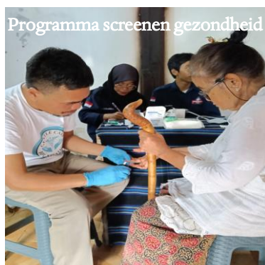
Programma screenen gezondheid