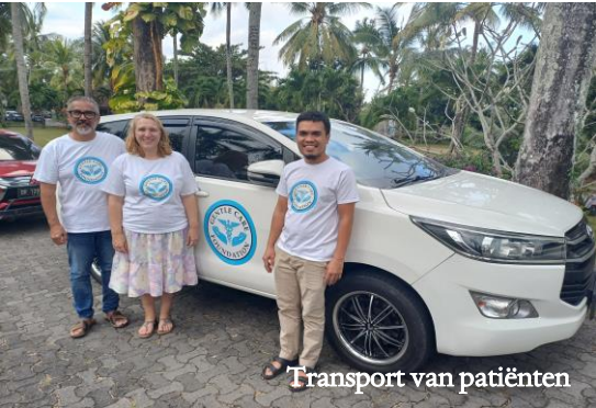
Transport van patiënten