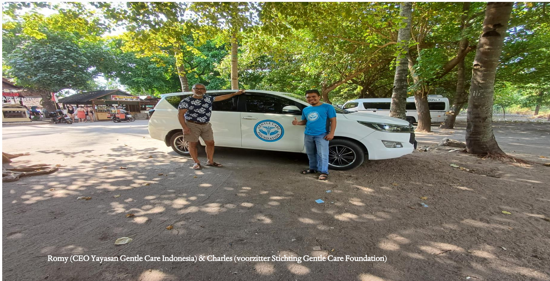
Romy (CEO Yayasan Gentle Care Indonesia) & Charles (voorzitter Stichting Gentle Care Foundation)