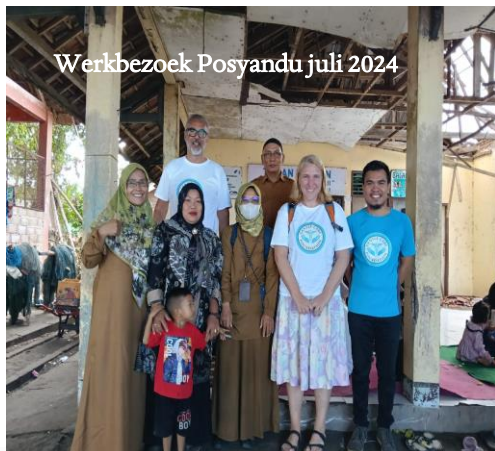
Werkbezoek Posyandu juli 2024