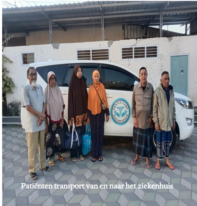
Patiënten transport van en naar het ziekenhuis